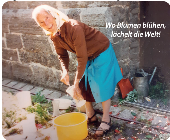
Wo Blumen blühen, lächelt die Welt!

Am 1. November war es endlich soweit, die Erinnerungsstätte für eine besondere, fleißige Frau, die mit