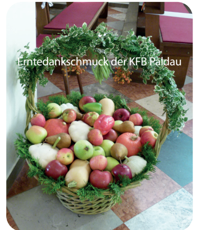
Erntedankschmuck der KFB Paldau