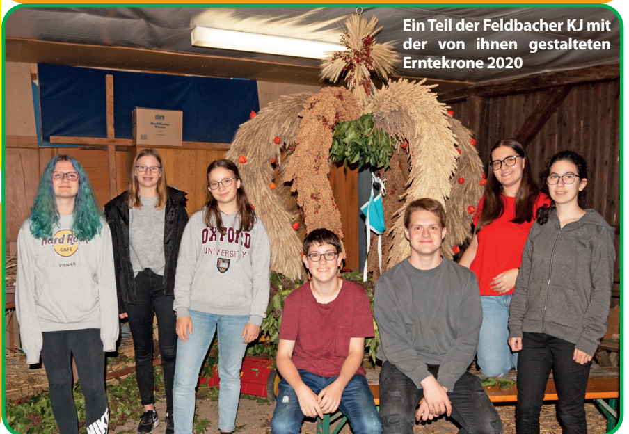
Ein Teil der Feldbacher KJ mit der von ihnen gestalteten Erntekrone 2020