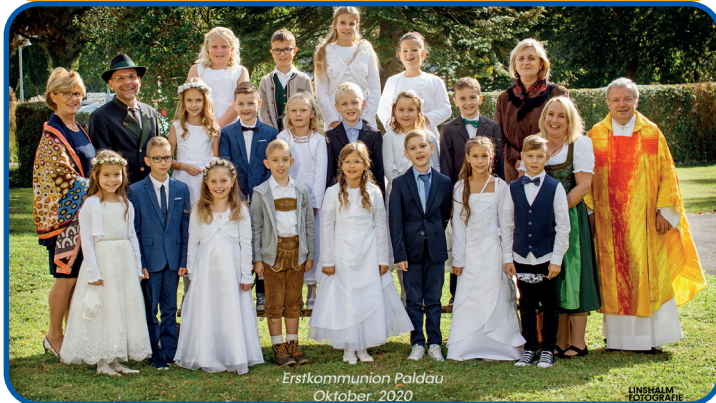
Erstkommunion Paldau Oktober 2020