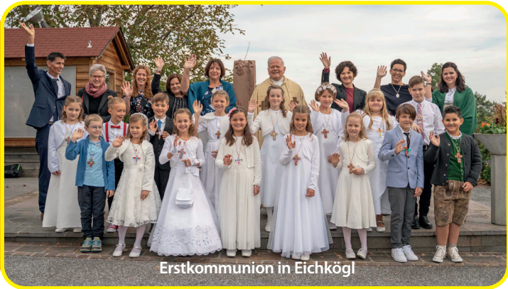
Erstkommunion in Eichkögl