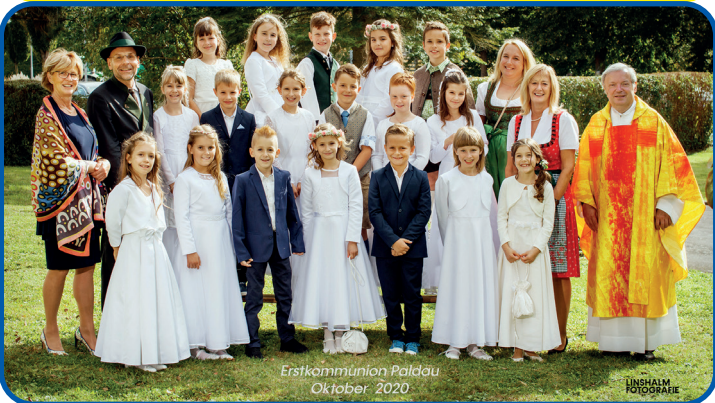
Erstkommunion Paldau Oktober 2020