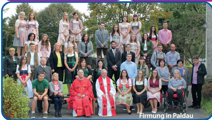
Firmung in Paldau