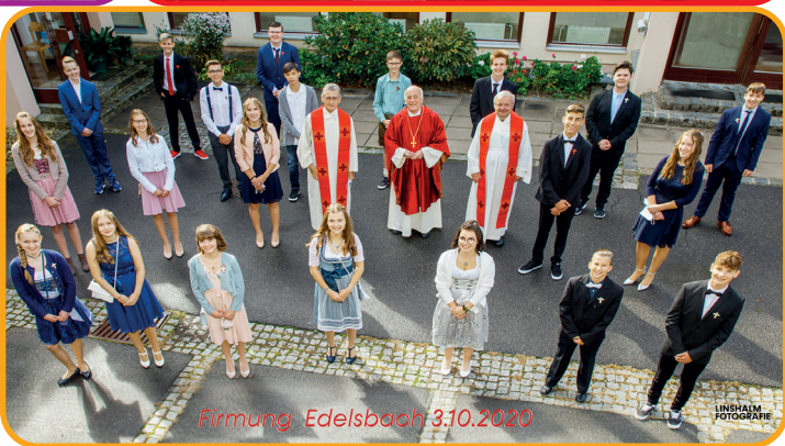
Firmung Edelbach 3.10.2020