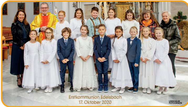
Erstkommunion Edelbach 17. Oktober 2020