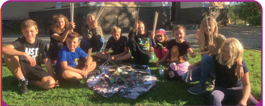
Dank der gespendeten, sehr guten Müllzangen, war das gemeinsame Müllsammeln für die Ministranten in Lödersdorf fast schon ein Vergnügen! Alle waren mit großem Eifer bei der „Putzaktion“ des Dorfes dabei! Ein herzliches Danke an die Helfer!