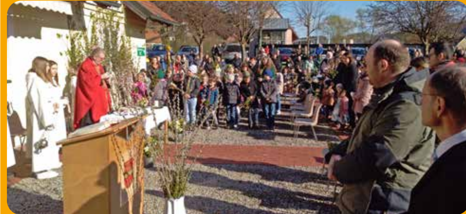
Palmsonntag in Edelsbach