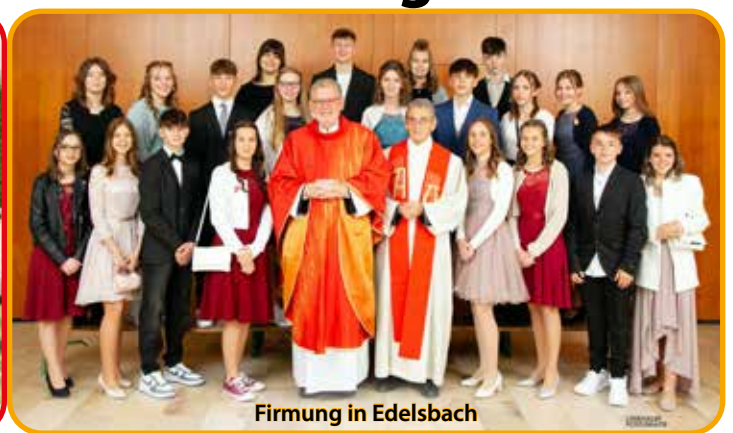
Firmung in Edelsbach