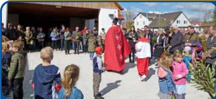
Palmsonntag in Paldau

Der Emmausgang konnte heuer nach einer zweijährigen Pause wieder stattfinden. Dieser Brauch, der an den österlichen Gang der Jünger nach Emmaus erinnern soll, führte die „Emmausjünger aus Edelsbach“ zur Gölleskapelle auf den Rohrberg.