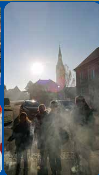
Karsamstag in Paldau