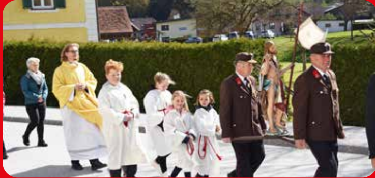
Ostersonntag in Breitenfeld