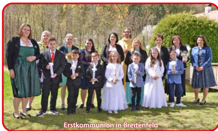
Erstkommunion in Breitenfeld