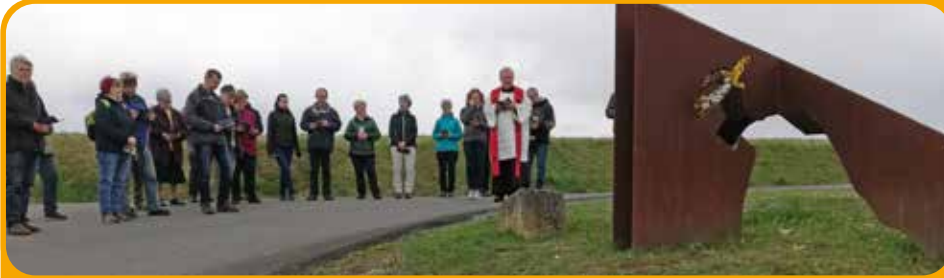
Kreuzweg in Edelsbach

Wer den Kreuzweg betet, geht mit Jesus die via dolorosa, lädt ihm all die eigenen Fragen und Anliegen mit aufs Kreuz. Sich auf den Weg machen und mit Jesus den Leidensweg zu gehen, um zu erkennen, dass er gleichsam auch unseren Leidensweg mitgeht. In der Fastenzeit gehen viele Menschen unseren Kreuzweg in Edelsbach. Bei jeder Station erinnern sich die Menschen meditierend und betend an den Leidensweg Jesu.