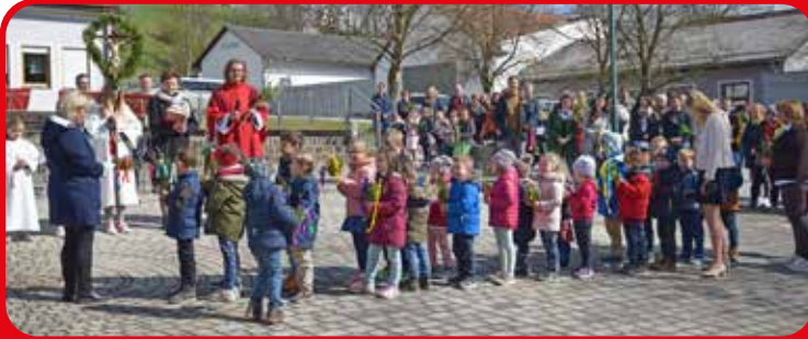
Palmsonntag in Breitenfeld

Die Kindergartenkinder gestalteten mit einem Gedicht die Segnung der Palmzweige auf dem Dorfplatz mit.