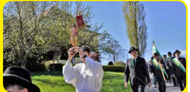
Ostersonntag in Eichkögl