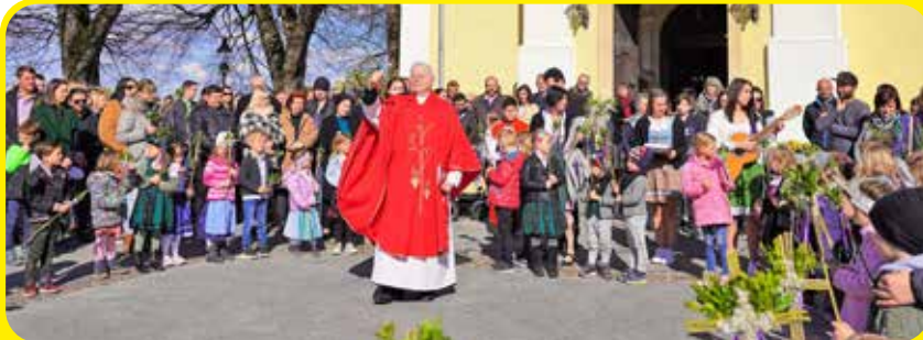
Palmsonntag in Eichkögl