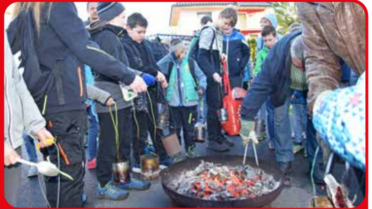
Karsamstag in Breitenfeld

Die Kindergartenkinder gestalteten mit einem Gedicht die Segnung der Palmzweige auf dem Dorfplatz mit.