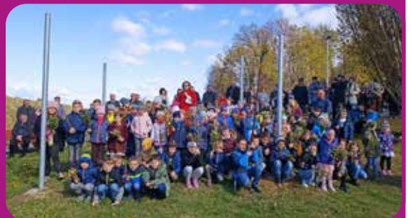
Palmsonntag in Riegersburg