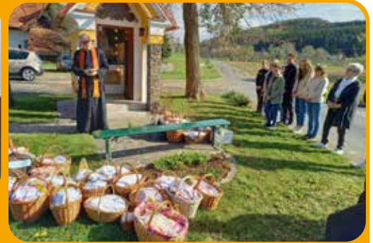
Karsamstag in Edelsbach

Wer den Kreuzweg betet, geht mit Jesus die via dolorosa, lädt ihm all die eigenen Fragen und Anliegen mit aufs Kreuz. Sich auf den Weg machen und mit Jesus den Leidensweg zu gehen, um zu erkennen, dass er gleichsam auch unseren Leidensweg mitgeht. In der Fastenzeit gehen viele Menschen unseren Kreuzweg in Edelsbach. Bei jeder Station erinnern sich die Menschen meditierend und betend an den Leidensweg Jesu.