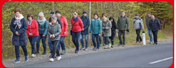
Ostersonntag in Breitenfeld

Feuerwehrmänner tragen den auferstandenen Heiland bei der Auferstehungsprozession.