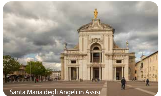
Santa Maria degli Angeli in Assisi