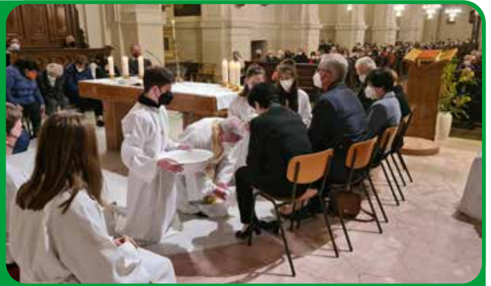
Gründonnerstag in Feldbach