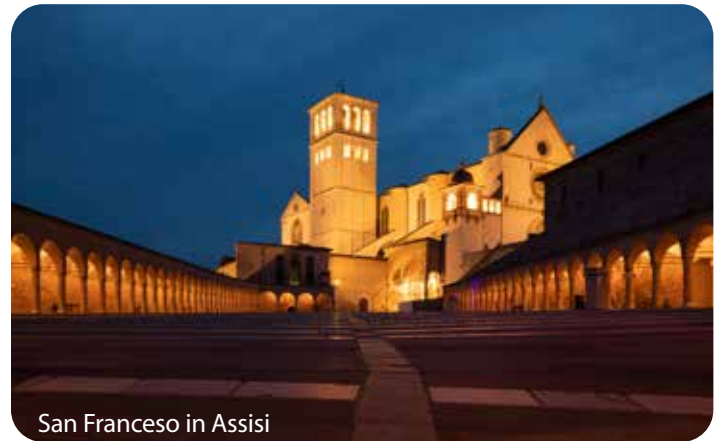
San Francesco in Assisi