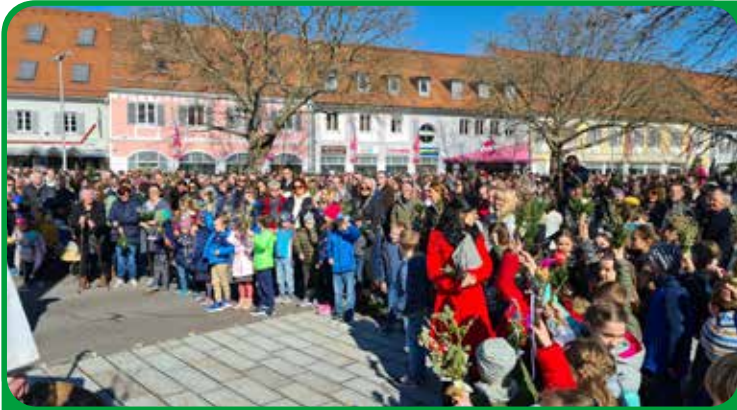
Palmsonntag in Feldbach