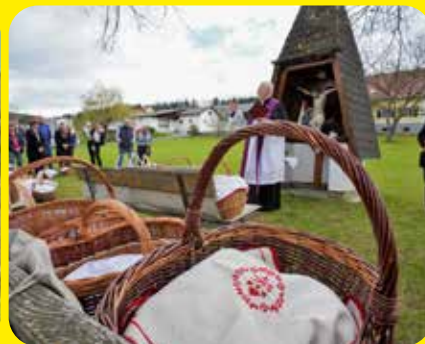
Karsamstag in Eichkögl