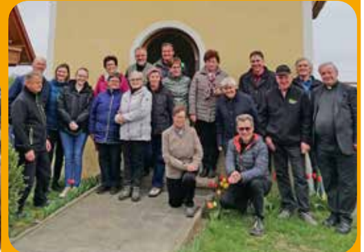
Emmausgang in Edelsbach

Der Emmausgang konnte heuer nach einer zweijährigen Pause wieder stattfinden. Dieser Brauch, der an den österlichen Gang der Jünger nach Emmaus erinnern soll, führte die „Emmausjünger aus Edelsbach“ zur Gölleskapelle auf den Rohrberg.