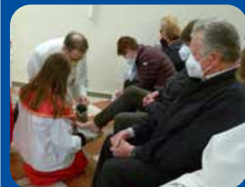
Gründonnerstag in Paldau