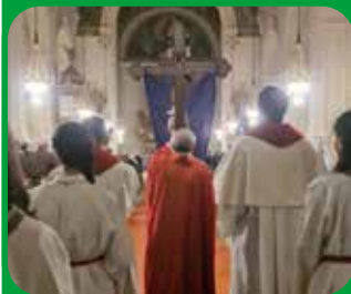
Karfreitag in Feldbach