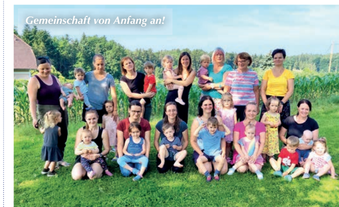
Gemeinschaft von Anfang an!

wöchentlich, jeweils dienstags von 9.00 – 11.00 Uhr in der Pension Kristiner bzw. im Pfarrheim St. Margarethen