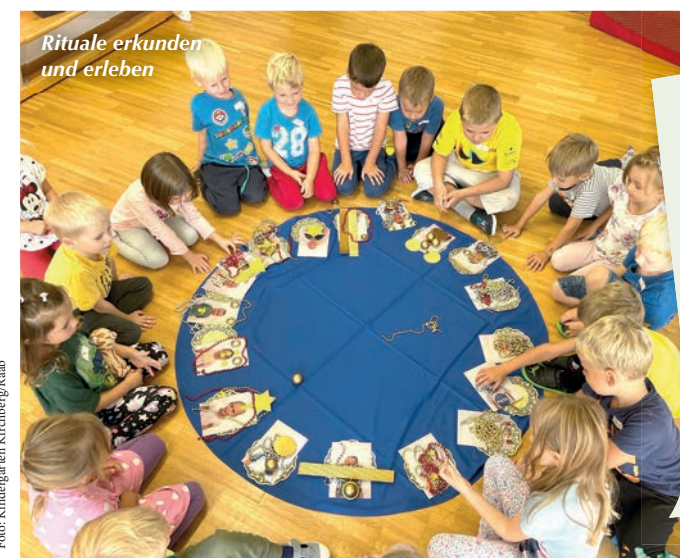
Rituale erkunden und erleben