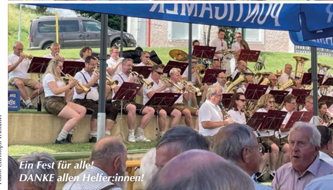
Ein Fest für alle! DANKE allen Helfer:innen!