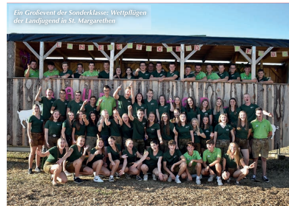
Ein Großevent der Sonderklasse: Wettpflügen der Landjugend in St. Margarethen