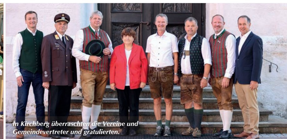
In Kirchberg überraschten die Vereine und Gemeindevertreter und gratulierten.