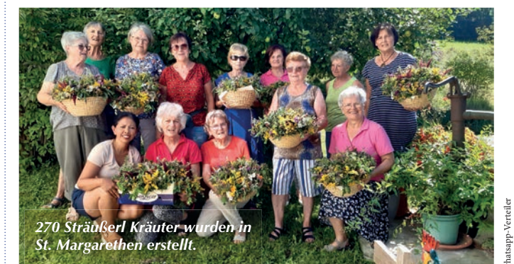
270 Sträußerl Kräuter wurden in St. Margarethen erstellt.

Auch heuer haben wir die schon lieb gewordene Tradition des Kräutersträußerlbindens zu Maria Himmelfahrt fortgesetzt. Das Brauchtum der Kräutersträußerln an diesem Marienfeiertag geht auf die Legende zurück, wonach im Grab Mariens statt ihres Leichnams duftende Blumen und Kräuter zu finden waren. Herzlichen Dank an die Frauen für die mitgebrachten Blumen und Kräuter und für das Binden der 270 Sträußchen. Diese bunten Sträußchen wurden im Rahmen des Gottesdienstes zu Maria Himmelfahrt gesegnet und an die Besucher verteilt. Heli Meister