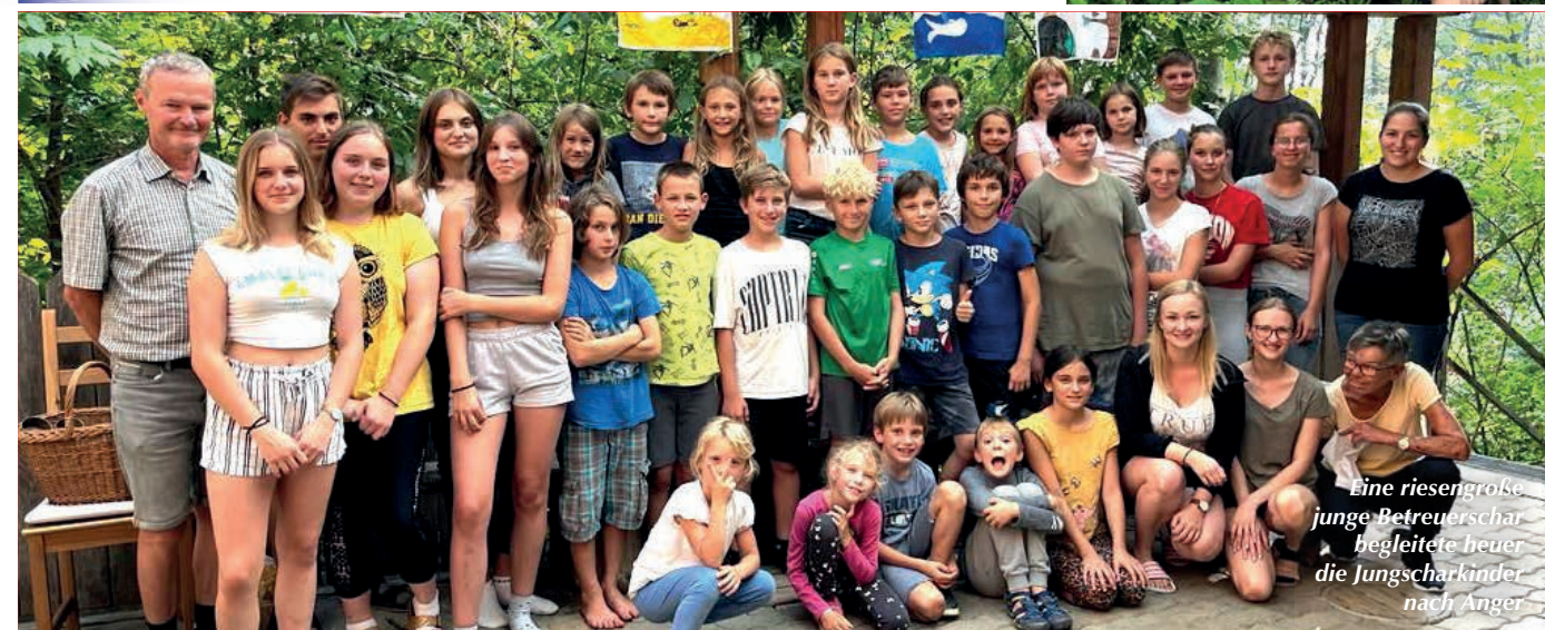
Eine riesengroße junge Betreuerschar begleitete heuer die Jungcharkinder nach Anger

JUNGSCHARTERMINE: 30. 9., 14.10., 25.11., 16.12., 13.01. & 10.02. jeweils von 10 - 11.30 Uhr | Jungcharlager 2024: 8. - 11. August 2024