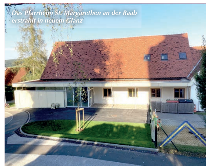
Das Pfarrheim St. Margarethen an der Raab erstrahlt in neuem Glanz