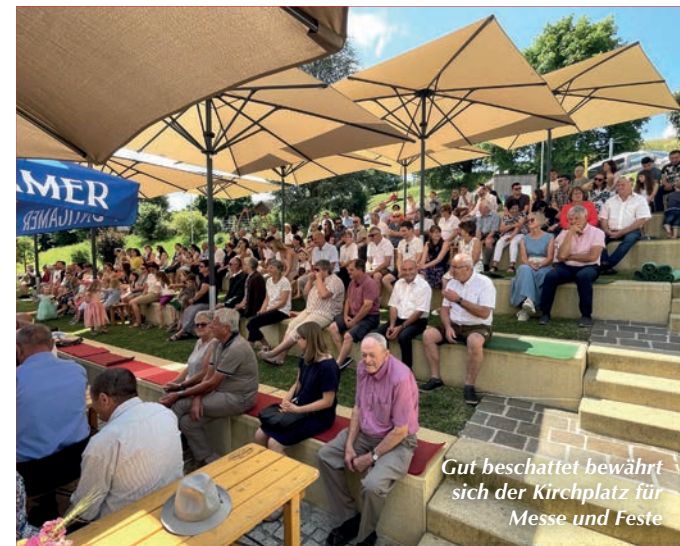
Gut beschattet bewährt sich der Kirchplatz für Messe und Feste

Das heurige Pfarrfest am 25. Juni wurde wieder von vielen fleißigen Helfern – rund um unsere Kirche – hervorragend vorbereitet. Alle PGR-Mitglieder freuten sich auf dieses gemeinsame christliche Fest. Die Wettervorhersage war ebenfalls optimistisch, bis ein kurzes, aber heftiges Gewitter am Freitagnachmittag mit einem gewaltigen Blitzschlag in den Kirchturm uns einige Schwierigkeiten bereitete.