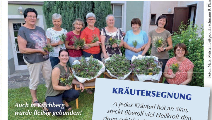
Auch in Kirchberg wurde fleißig gebunden!

KRÄUTERSEGNUNG A jedes Kräuterl hot an Sinn, steckt überoll viel Heilkroft drin, drum schick i dir an klanen Strauß, dasst gsund bleibst übers Jahr hinaus!