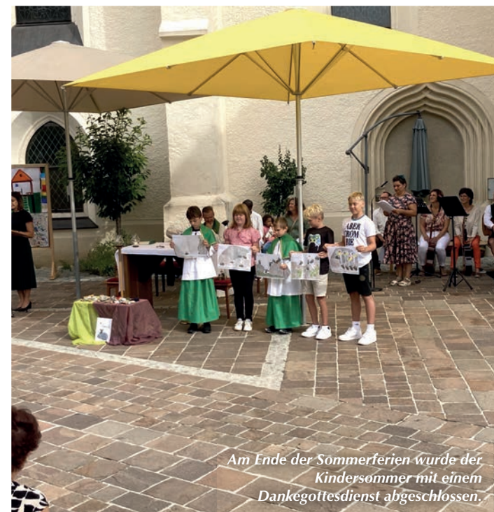
Am Ende der Sommerferien wurde der Kindersommer mit einem Dankgottesdienst abgeschlossen.