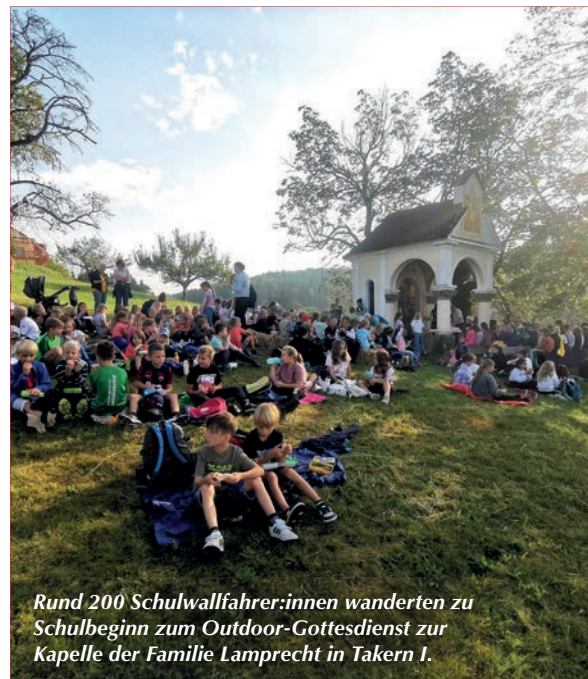
Rund 200 Schulwallfahrer:innen wanderten zu Schulbeginn zum Outdoor-Gottesdienst zur Kapelle der Familie Lamprecht in Takern I.