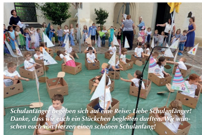
Schulanfänger begeben sich auf eine Reise: Liebe Schulanfänger! Danke, dass wir euch ein Stückchen begleiten durften. Wir wünschen euch von Herzen einen schönen Schulanfang!